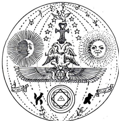
Σύμβολο του Αρχαίου και Αρχέγονου Ανατολικού Τύπου Misraim και Memphis

Θα πρέπει να περάσει ακόμα πολύ καιρός προτού συντελεσθεί η συγχώνευση μεταξύ μύησης και χειροτονίας, που θα επισημοποιήσει το τέλος του αγώνα και την απαρχή της ανόδου της ανάληψης θείας συνείδησης από την πλευρά της ανθρωπότητας!