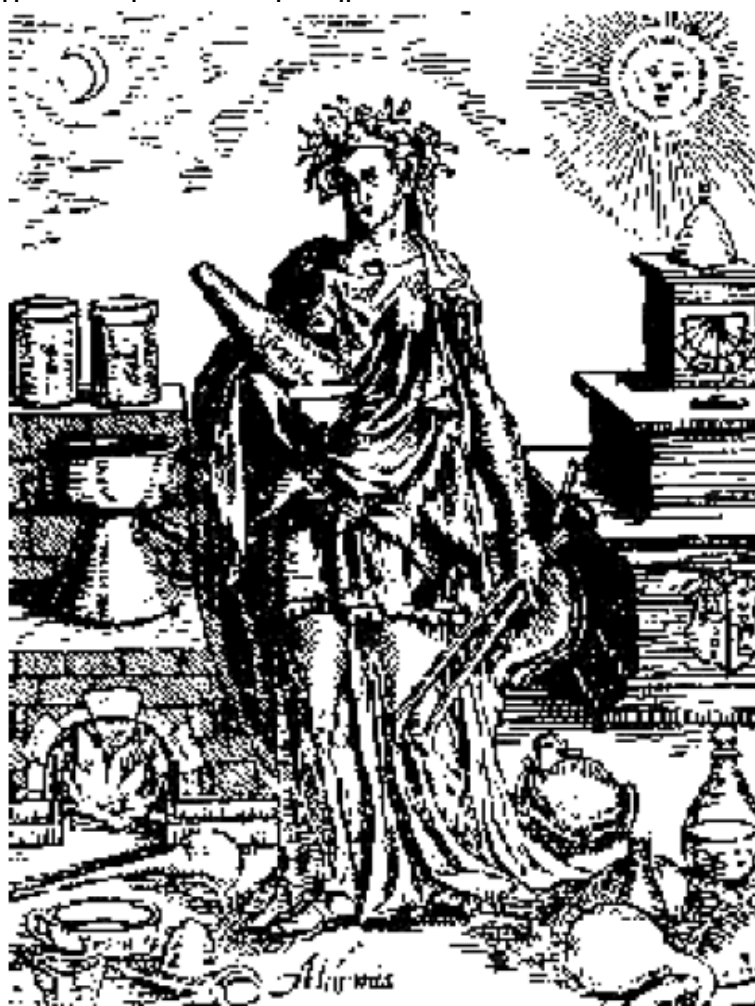
Alchimia - Leonhard Thurneysser, 1574.

Όμως, πριν ασχοληθούμε με την μελέτη της Αλχημείας, κρίνω σκόπιμο και κατάλληλο, να εξετάσουμε τον Σμαράγδινο πίνακα του Ερμή του Τρισμέγιστου, αυθεντικά Ερμητικό, και τον Ρουμπινένιο Πίνακα, αγνώστου συγγραφέα, που εμφανίζεται αντίθετος στον Σμαράγδινο, αλλά που στην πραγματικότητα τον συμπληρώνει.