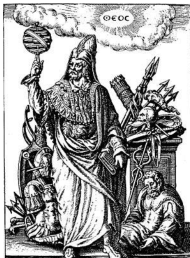
Ερμής ο Τρισμέγιστος